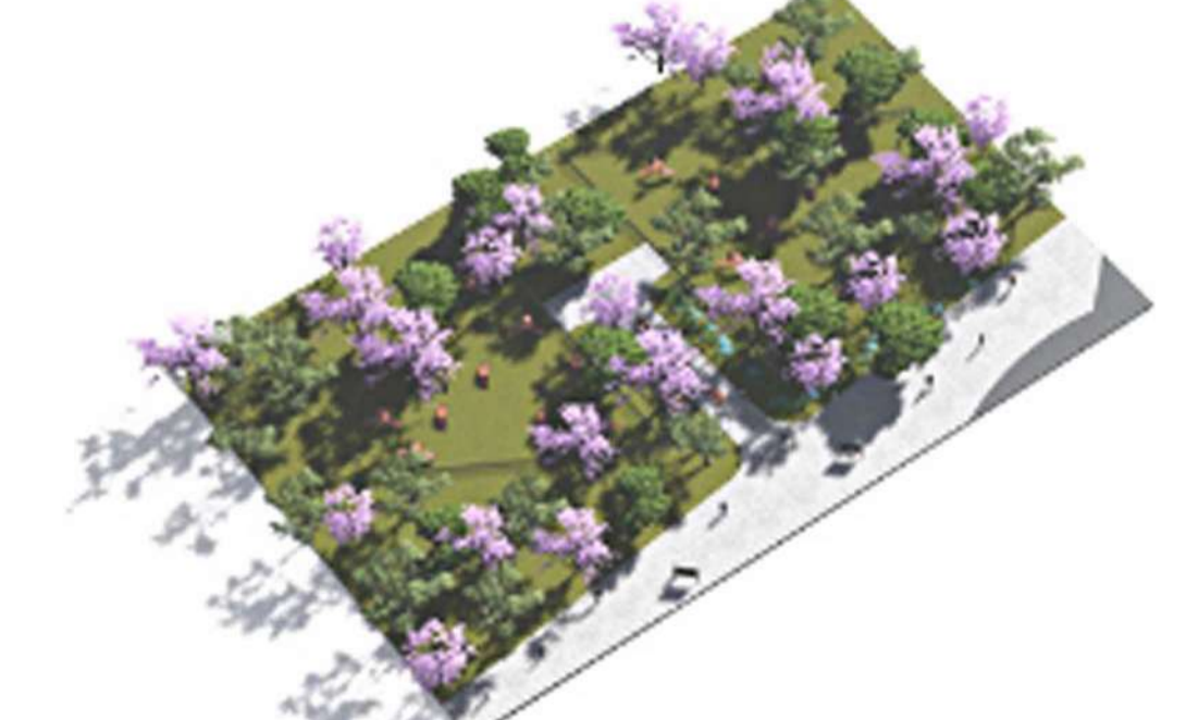
Parque para Perros. Contaremos con dos parques, uno para perros grandes y otro para perros más pequeños.