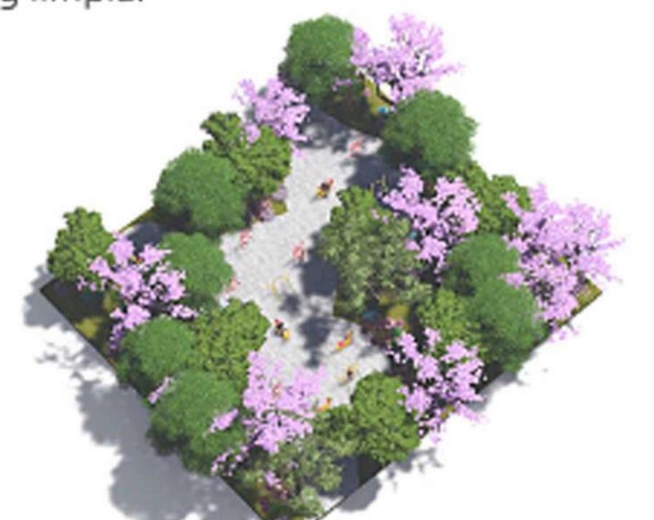
Gimnasio. Contaremos con un área destinada a hacer ejercicio con aparatos para cardio y peso.