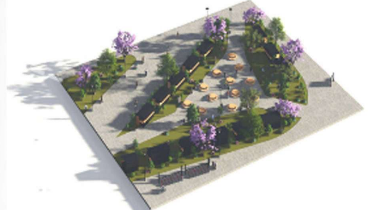
Área de Comida. Los puestos ambulantes serán reorganizados y se proveerán de infraestructura para operar de manera eficiente y limpia.