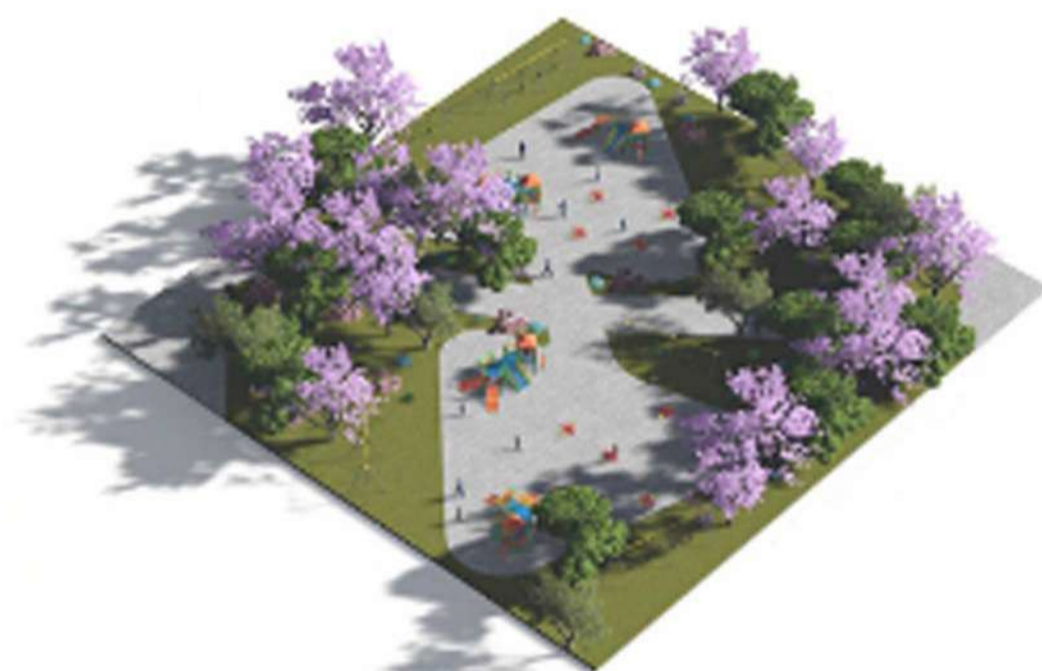
Juegos Infantiles. El conjunto contará con un área destinada a juegos infantiles para los más pequeños.