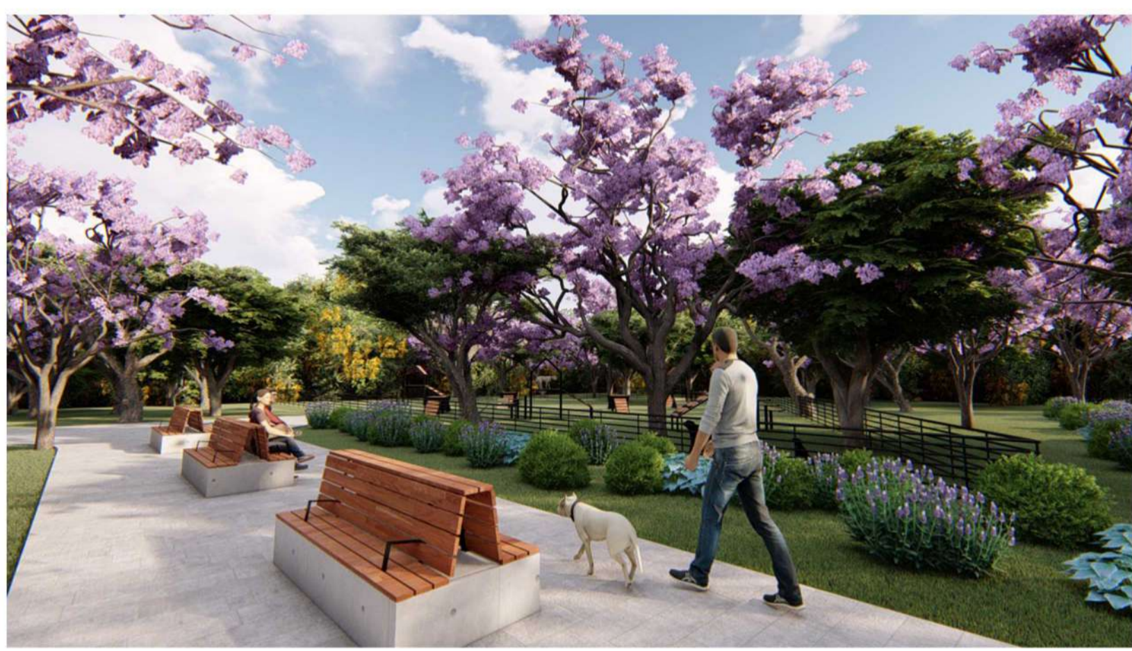
Parque para perros