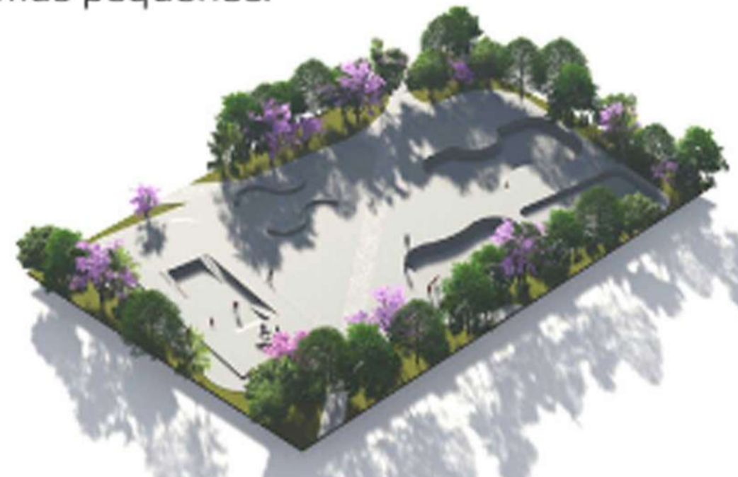
Skatepark. El conjunto contará con un skatepark para jóvenes adolescentes.