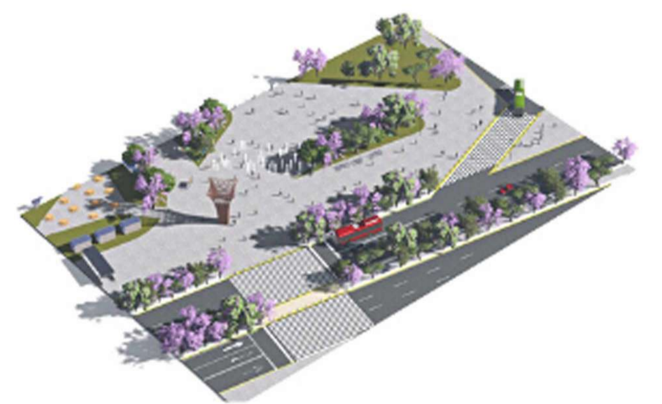
Plaza de Acceso. En la plaza principal podemos encontrar las fuentes, la estela de acceso, y los cruces peatonales.